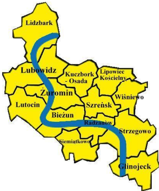
Mapa 1 Mapa obszaru SSS LGD

Badanie ewaluacyjne finansowane ze środków Europejskiego Funduszu Rolnego na rzecz Rozwoju Obszarów Wiejskich: Europa inwestująca w obszary wiejskie w ramach poddziałania „Wsparcie na rzecz kosztów bieżących i aktywizacji” PROW na lata 2014-2020